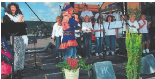
KOR-ONA skapte liv og røre med sang og artige påfunn.