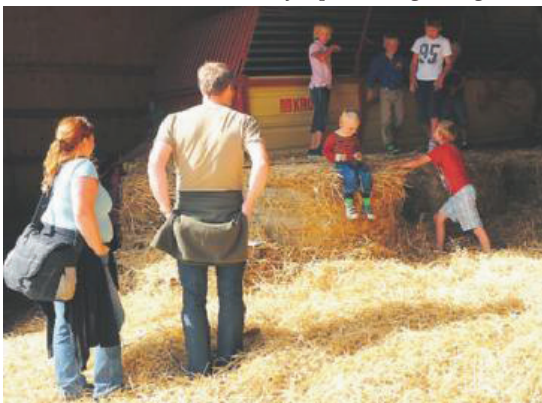
HOPPING I HØYET går aldri av moten. Her fra Lille Ve.