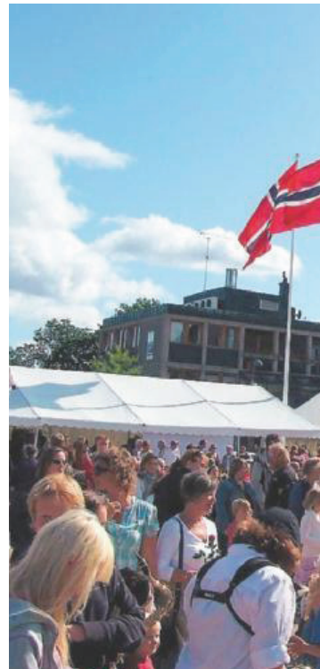
7000 BESØKENDE. Festivalledelsen regner med at opp mot 5000 mennesker besøkte Økofestivalen lørdag og søndag. Det ble livlig på torget!

På Lille Ve var det åpen gård for dem som liker gårdsdyr og som ønsket et innblikk i økologisk gårdsdrift.