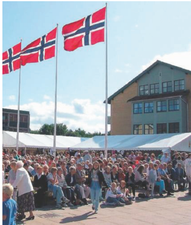
Mer med at opp mot 5000 mennesker besøkte Økofestivalen lørdag og hvor også tilstrømmingen fra kommunene rundt Sande var stor.