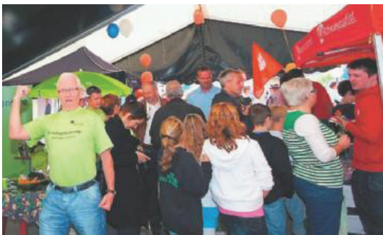
VISTE MUSKLER. Politikerne kjempet om velgernes gunst.