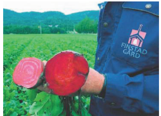
RØDBETER. Ulike typer produseres på Finstad Gård Rosnes.

- Jeg tror dette prosjektet vil bety et skikkelig løft for økologisk mat i dette landet og blir et viktig bidrag for å nå målsetningen om 15 prosent økologisk matproduksjon og forbruk innen 2015, sa daværende kommunal- og regionalminister Åslaug Haga.